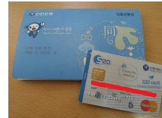
新韓銀行簿子及卡片