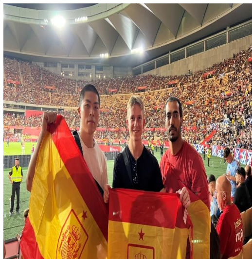
和室友一起去看西班牙國家隊比賽