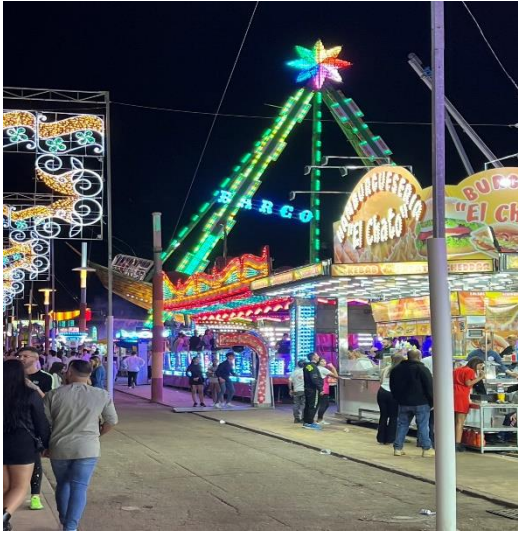
哈恩的一年一度的園遊會